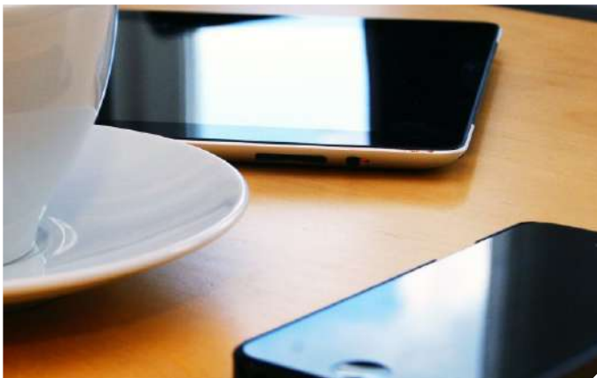
Cumplir con todas las obligaciones fiscales a las que se encuentre sujeto el contribuyente, y en caso de dudas, acudir ante la autoridad fiscal.

COLEGIO DE CONTADORES PÚBLICOS DE MÉXICO, A.C. 🕒 20 JUL, 2021